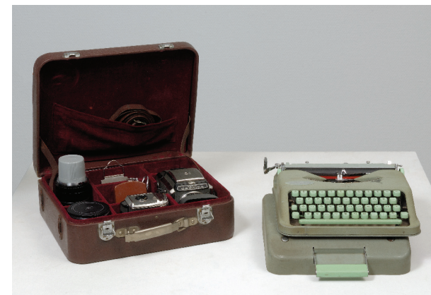
Máquina fotográfica e máquina de escrever de Santos Simões.

segura de que, desde sempre, foram as criações modernas que, em todos os tempos, construíram a História e a Cultura dos povos.